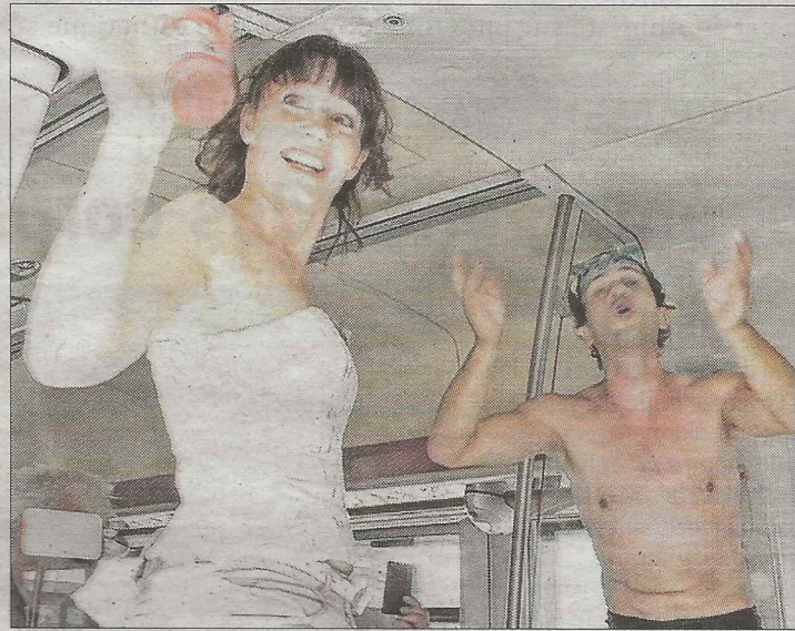
■ Fantaisie ferroviaire foutraque et gaie pour les voyageurs du Dijon.

Ils sont mecènes et partenaires du festival